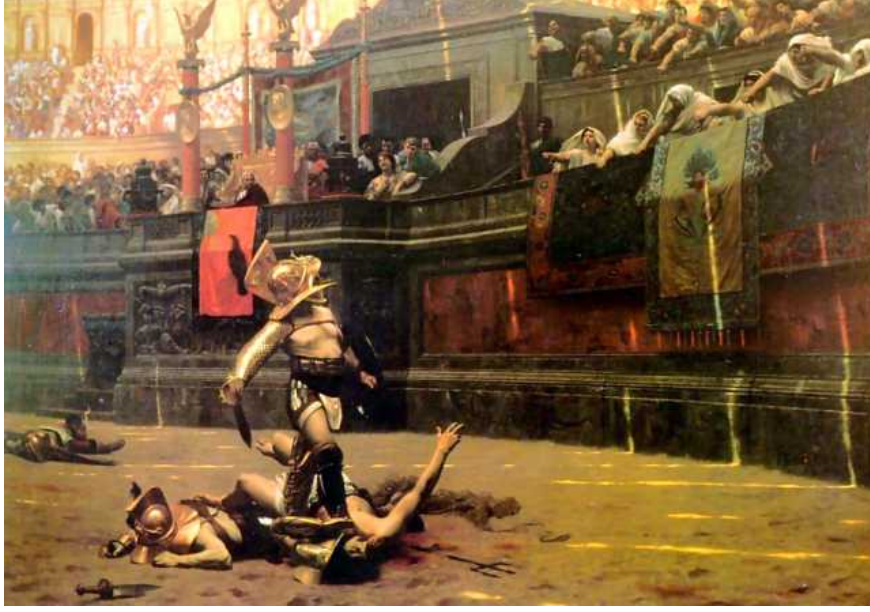
Resim 2- Rakibi etkisiz hale getirerek, missio talep ettiren ve sonuna ilişkin kararı tribünlerden bekleyen galip bir gladyatör sahnesi.