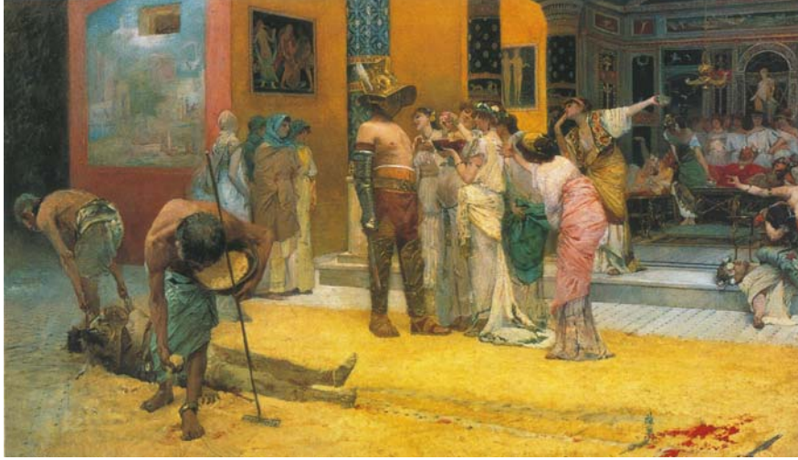
Resim 4- Oyunun sonunda yenilen gladyatörün cesedi arenadan uzaklaştırılırken, yerdeki kan lekeleri görevli bir köle tarafından kumla örtülmeye çalışılmaktadır. Aynı sahne içerisinde tasvir edilen galip ve mağrur gladyatöre Romalı kadınlar tarafından gösterilen yakın ilgi dikkat çekmektedir.