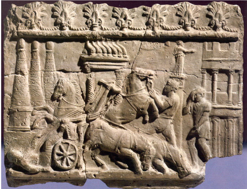
Resim 10- İki tekerlekli hafif savaş arabalarıyla tasvir edilen Essedarius grubu.