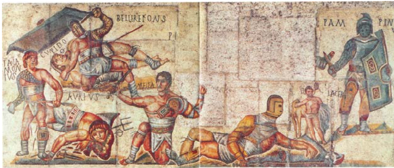
Resim 5- Farklı türde gladyatör dövüşçüsünü gösteren mozaik sahnesi.