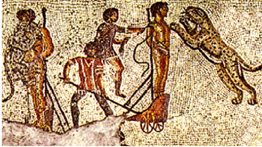
Resim 8- Çeşitli enstrümanlar kullanılarak ve muhafızlar eşliğinde bağlı olarak arenaya getirilen suçlunun infazını gösteren bir sahne.