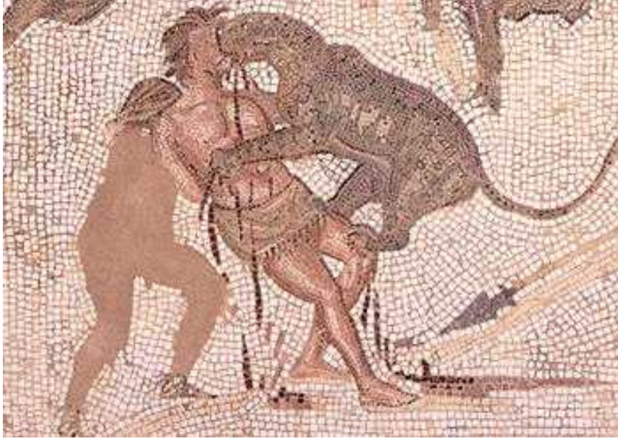
Resim 7- Öğle arasında ağır suçluların infazının gerçekleştirilmesini gösteren bir mozaik.