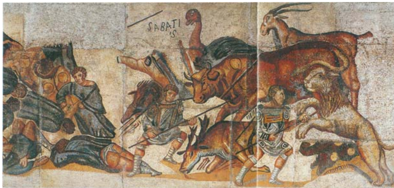
Resim 6- Sayısız türde vahşi hayvan dövüşünü tasvir eden mozaik.