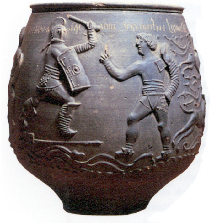
Resim 3- Secutor'a karşı dövüşü kaybettiği anlaşılan ve bu nedenle af dileyen ( missio ) bir Retiarius .