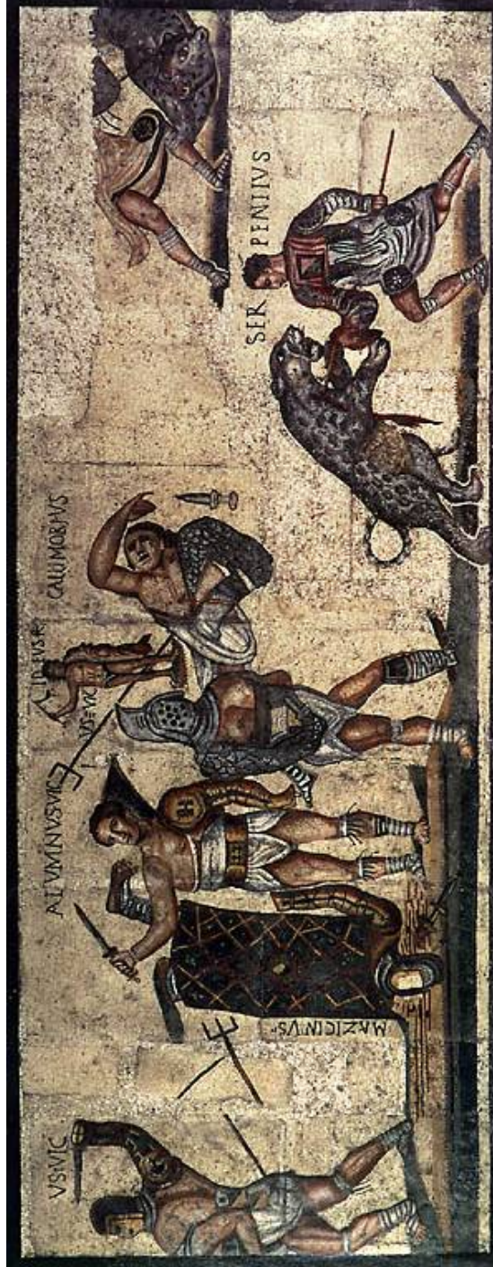
Resim 1- Bir yanda farklı silahlarla birbirlerine karşı ölüm kalım mücadelesi veren gladyatörler, diğer yanda vahşi kaplanlara karşı kendini savunmaya çalışan vahşi hayvan dövüşçüleri görünmektedir.