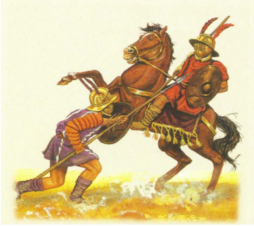
Resim 11- Birbirlerine karşı dövüşen Eques türü gladyatörler.