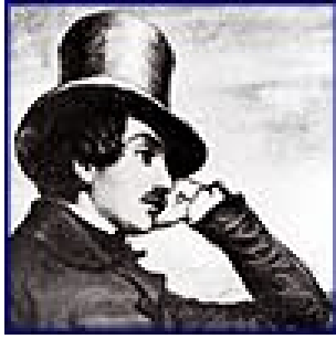
August Ludwig von Rochau (1810-1873)

Cumhurbaşkanlığı seçimi için dikkate alınmasında fayda bulunan bir prensip olduğunu düşünüyorum.